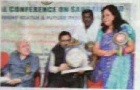
● புதிய மாநில சர்க்கார் ● மாநில சர்க்கார் ● மாநில சர்க்கார்

யும் பெறும். இவற்று மதிப்புகள் பொருளாதாரம் யார்ச்சி பெறும் நம் விவசாயிகளும் கோமல்வார்களாக யாரும் நாம் வெகுநாட்களில்" என்று பூரிப்புடன் பேசினார்.